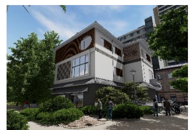
下町風俗資料館イメージ図

★谷中地区まちづくり推進 (朝倉彫塑通りに「街並み環境整備事業」導入) 13,940千円