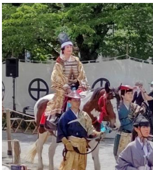
浅草流鏝馬、総奉行役で