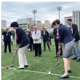
姉妹区ゲートボール大会