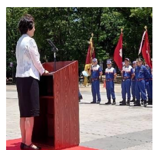
上野消防団操法審査会